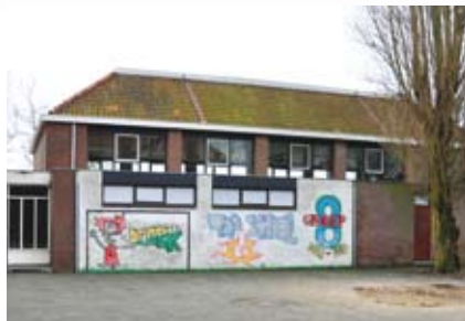
Gymmen wordt een uitje naar een echte sporthal

VERLOOPT ALLES VOLGENS PLANNING, DAN VALT DEZE ZOMER DE HUIDIGE ZAAL TEN PROOI AAN DE SLOOPHAMER.