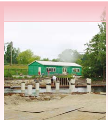
De pijlers van de brug zijn al geslagen en er wordt hard gewerkt om alles volgens planning te laten verlopen

Bij de aanleg van de brug en het fietspad is een gedeelte van het schoolterrein met hekken afgezet als bouwterrein. De gemeente en het schoolbestuur zullen nauwlettend in de gaten houden of het schoolplein voldoende is afgeschermd. De bouw aan de nieuwe brug duurt tot oktober. In september start de aanleg van het fietspad. De gemeente probeert de overlast voor de school zoveel mogelijk te beperken.